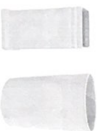
Рис. 2 - Стаканы керамические: