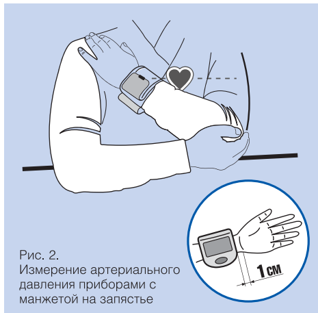
Рис. 2. Измерение артериального давления приборами с манжетой на запястье

Измерители артериального давления на запястье не всегда рекомендуется использовать людям с выраженными изменениями стенок сосудов и нарушениями периферического кровоснабжения (атеросклероз, диабет и т.д.). В этих случаях перед использованием прибора с манжетой на запястье необходимо выполнить контрольное измерение прибором с манжетой на плечо и убедиться в отсутствии большой разницы в показаниях.