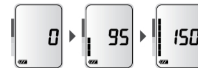
Процесс накачки манжеты