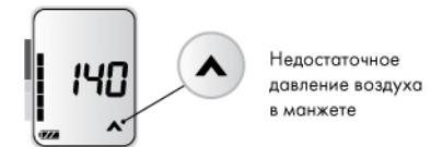
Недостаточное давление воздуха в манжете