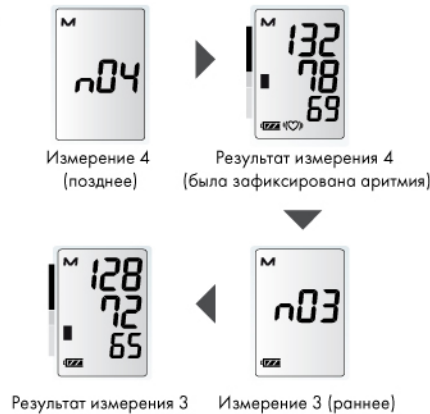
Измерение 4 (позднее)

Удалите элемент питания из отсека на несколько секунд и вставьте его снова.