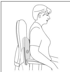
Массаж спины: нижняя часть спины (поясничный отдел позвоночника)