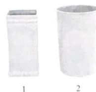
Рис. 2 - Стаканы керамические: 1. Стакан лабораторный керамический АГФТ 8.634.001 2. Стакан лабораторный керамический АГФТ 8.634.002

4.8 Принцип работы электроактиватора воды АП - 1 основан на мембранном электролизе. В качестве мембраны используется конструкция в виде пористого керамического стакана. Электролиз воды - это химическая реакция разложения воды на положительные и отрицательные ионы при пропускании через нее тока от источника постоянного напряжения