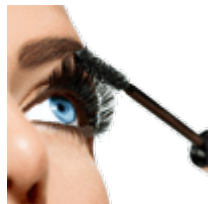
Тушь для ресниц