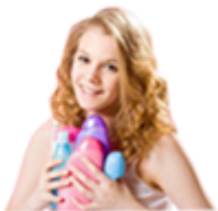
Шампуни, кондиционеры и бальзамы