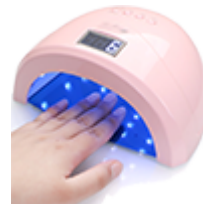
Лампы для маникюра